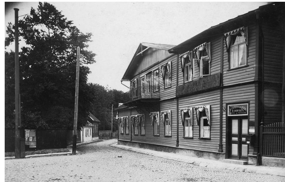
Meissneri pansion, Lasteaia 8